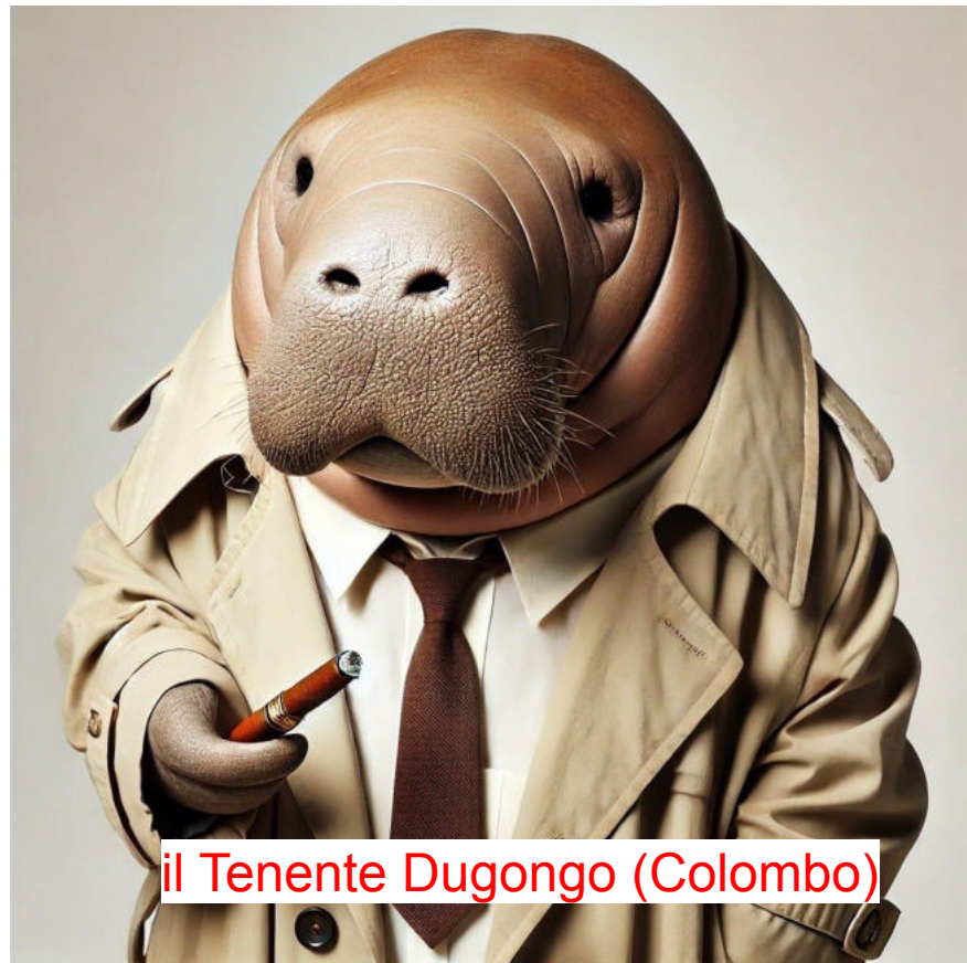
il Tenente Dugongo (Colombo)